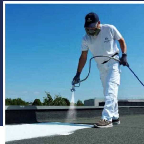
Appliquer une peinture réfléchissante pour isoler le toit de la chaleur.

Nous sommes convaincus que des solutions existent pour contribuer à lutter contre le réchauffement climatique et l'augmentation du coût de l'énergie.